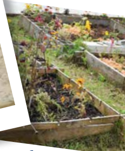
Le jardin du CSC