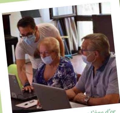
Cours d'informatique avec l'âge d'or