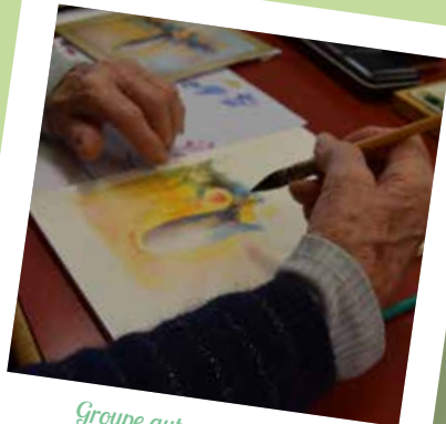
Groupe autonome peinture