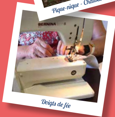
Doigts de fée