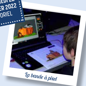
La bande à pixel

VENDREDI 21 ET SAMEDI 22 JANVIER 2022 À L'ORIEL