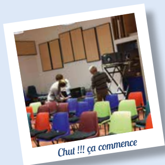
Chut !!! ça commence

L'équipe de bénévoles : cineclubvarces@gmail.com