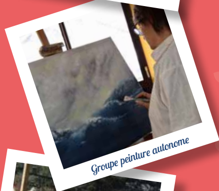
Groupe peinture autonome