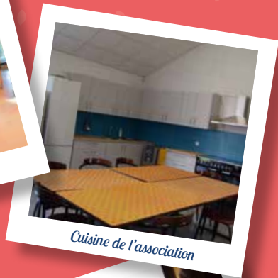
Cuisine de l'association