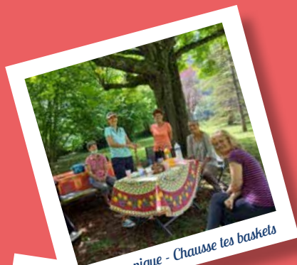
Pique-nique - Chausse tes baskets

Le groupe se réunira ensuite toutes les 2 semaines de 14h à 16h30 (hors vacances scolaires) à partir du 4 octobre.