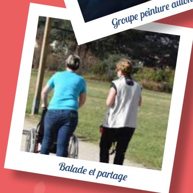
Balade et partage