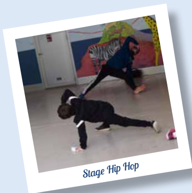
Stage Hip Hop

DES ACTIVITÉS RÉGULIÈRES DU 20 SEPTEMBRE AU 24 JUIN (HORS PÉRIODES DE VACANCES SCOLAIRES) ET DES STAGES PONCTUELS POUR TOUT PUBLIC ENCADRÉS PAR DES INTERVENANTS QUALIFIÉS.