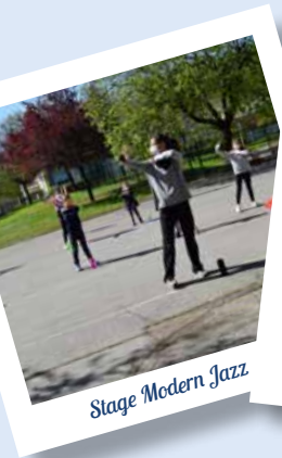
Stage Modern Jazz