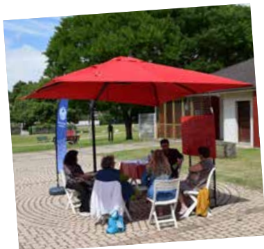
L'arbre à palabres